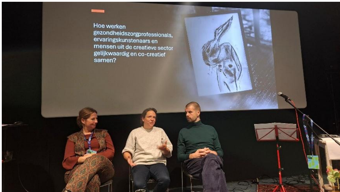
Dutch Design Week oktober 2025